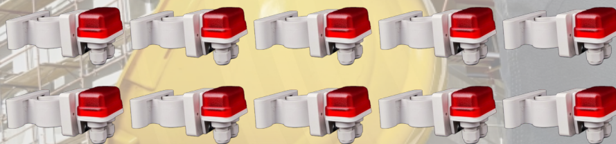
LUCI DI SICUREZZA A LED 12-24V COLORE ROSSO + CLIP DI FISSAGGIO UNIVERSALE SU PALINA

FUNZIONI: ON-OFF GESTIONE DAY-NIGHT: CON CREPUSCOLARE LUCE: LAMPEGGIANTE