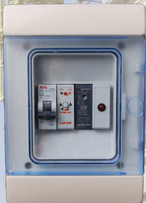
CENTRALINA GESTIONE LUCI DI SICUREZZA 12V

FUNZIONI: ON-OFF GESTIONE DAY-NIGHT: CON CREPUSCOLARE LUCE: LAMPEGGIANTE