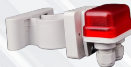
ACCESSORIO LUCI LED AGGIUNTIVO

IL SISTEMA LAVORA IN BASSA TENSIONE 12 VOLT SECONDO LE NORME VIGENTI