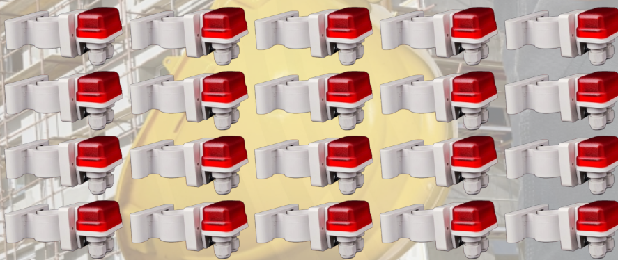
LUCI DI SICUREZZA A LED 12-24V COLORE ROSSO + CLIP DI FISSAGGIO UNIVERSALE SU PALINA

CLICCA SULLA DICHIARAZIONE DI CONFORMITÀ PER SCARICARLA