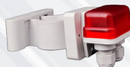
ACCESSORIO LUCI LED AGGIUNTIVO

IL SISTEMA LAVORA IN BASSA TENSIONE 12 VOLT SECONDO LE NORME VIGENTI