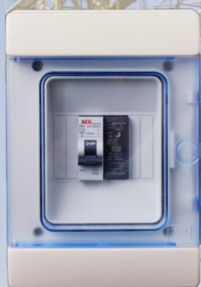
CENTRALINA GESTIONE LUCI DI SICUREZZA 12V