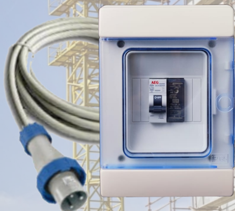
CENTRALINA GESTIONE LUCI DI SICUREZZA 12V